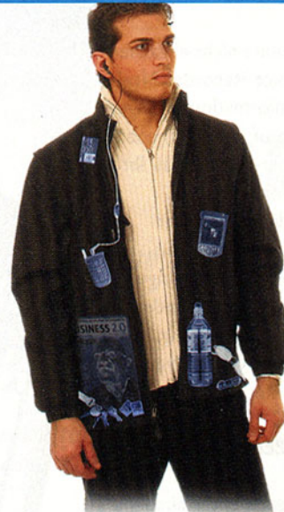
Die Jacke Scott eVest bietet viele Taschen für elektronische Geräte aller Art

Preis: ab 119 US-Dollar. Hersteller: Scott eVest LLC, Internet www.scottevest.com